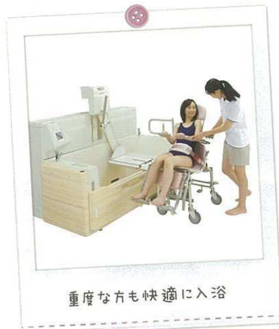
重度な方も快適に入浴