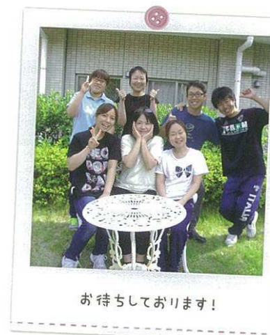
お待ちしております!